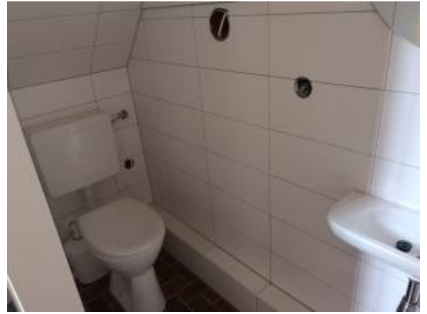
29. März: Die Fliesen sind an der Wand.